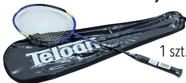
Rakieta TeloonT L300 - jednoczęściowa