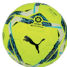
Piłka Puma La Liga Hybrid Atest FIBA