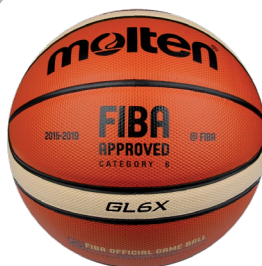
Molten GL6X Atest FIBA skórzana