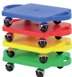
Platforma na kółkach